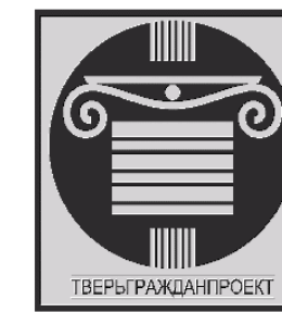
Схема мероприятий по охране окружающей среды Городского округа город Торжок